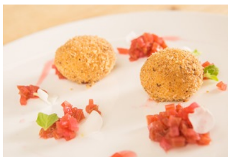
Die Topfenknödel auf dem Rhabarberragout anrichten.

Das Wasser mit dem Zucker, Zitronensaft und Vanille aufkochen und auf die Hälfte einreduzieren lassen. Den Rhabarber in kleine Stücke schneiden, in der Flüssigkeit einmal aufkochen und auskühlen lassen.