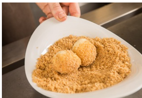
Für die Brösel:

Die Butter unter Rühren anbräunen, die restlichen Zutaten dazugeben und zusammen für ein paar Minuten anrösten.