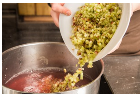
Für das Rhabarberragout:

Anschließend die Topfenknödel in den Bröseln wälzen.