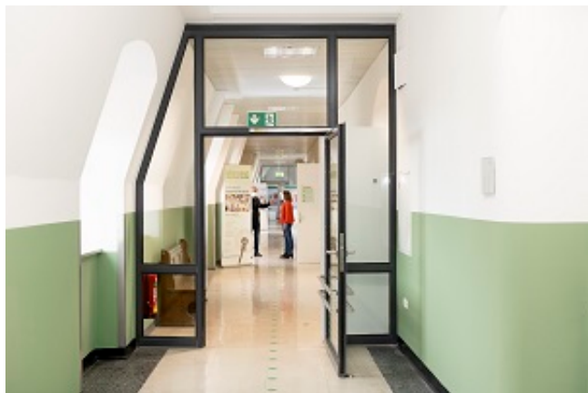
Das Patientenhaus des CCC M